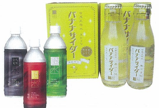
E ピュアラ「合馬天然水 竹採物語」 (500ml、150円～280円) 「バナナサイダー」 (95ml 2本入り、1260円)

D 「北九州」と「来た九州」をかけたネーミングとカエルのキャラクターがユニークです。バームクーヘンは一層一層丁寧に焼き上げられた優しい味わい。☎0120・470・961