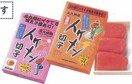
B 西海「イケメン」 (180g、1050円)