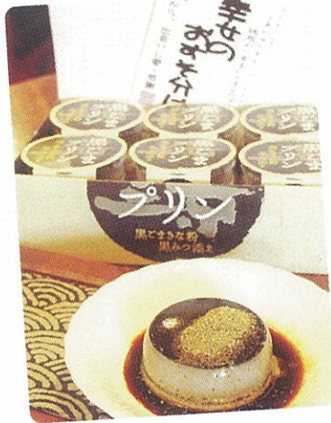
A 福岡「黒ごま三景プリン」 (1個399円)