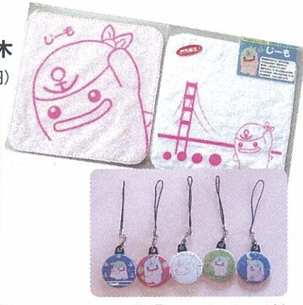
I カラーテック工業「じ〜もグッズ」 (300円～650円)

■読者のみなさまへ リビング新聞は無料で毎週木曜日または金曜日にお届けしています。もしも、遅れて配られる、時折入らないことがある、あるいは配布を希望しないなど、配布上の問題がございましたら、右記までご連絡ください。リビングプロシード「リビング新聞」配布担当まで ☎522・4410 (月～金曜日 9:30～17:30)