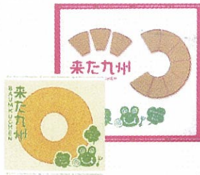
D 湖月堂「来た九州バームクーヘン」 (14cmホール840円、10カット入り1260円)