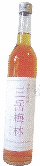
F 無法松酒造「小倉の梅酒三岳梅林」 (500ml、1260円)